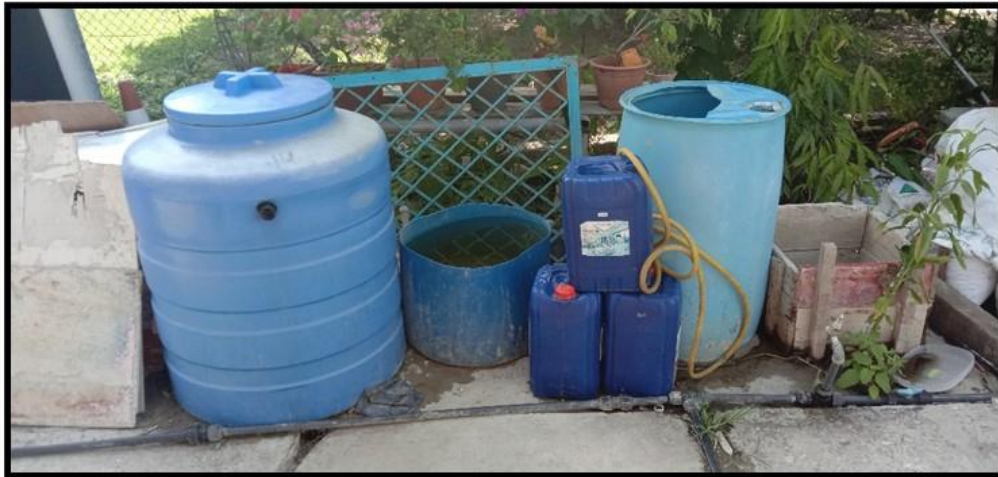
Rajah 4. Penduduk menadah air hujan sebagai bekalan sumber air tambahan.

Hasil pemerhatian mendapati rata-rata penduduk masih membuat tadahan air hujan dan disimpan ke dalam takungan air seperti tangki, baldi dan botol. Langkah tersebut adalah untuk memastikan penduduk dapat melakukan aktiviti seharian seperti memasak, membersihkan diri, mencuci pakaian serta sebagai bekalan air minuman meskipun bekalan air paip terputus. Temubual bersama salah seorang daripada pekerja perkhidmatan inap desa berkata: