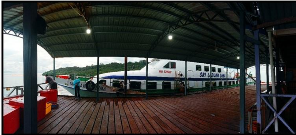
Rajah 3. Pengangkutan utama penduduk daripada Daerah Kudat ke Pulau Banggi.

Walaubagaimanapun, semasa temu bual bersama informan di lokasi kajian, mereka lebih menyatakan aspek pembangunan jalan raya perlu terlebih dahulu diutamakan. Informan ketiga menyatakan dalam temu bual bahawa kemudahan jalan raya di Pulau Banggi masih lagi berasaskan tanah kuning, dan sekiranya berlaku kerosakan jalan, penduduk harus segera memperbaikinya untuk mengelakkan sebarang kesulitan melanda penduduk yang membawa kenderaan. Dalam temu bual, informan ketiga menyatakan: